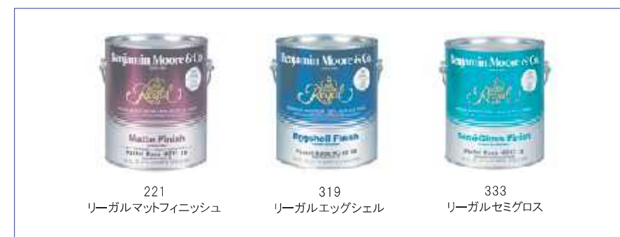
221 リーガルマットフィニッシュ