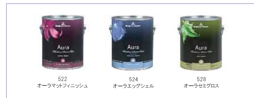
522 オーラマットフィニッシュ